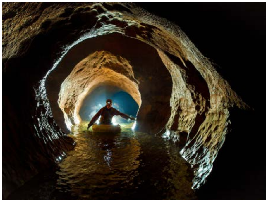
Navigation sur la rivière suspendue

Du bas du P43, la galerie continue à sec (sauf forte crue) et conduit à la dernière série de puits : après un ressaut de 4 m, de petites