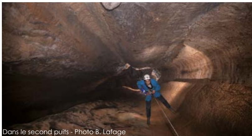
Dans le second puits