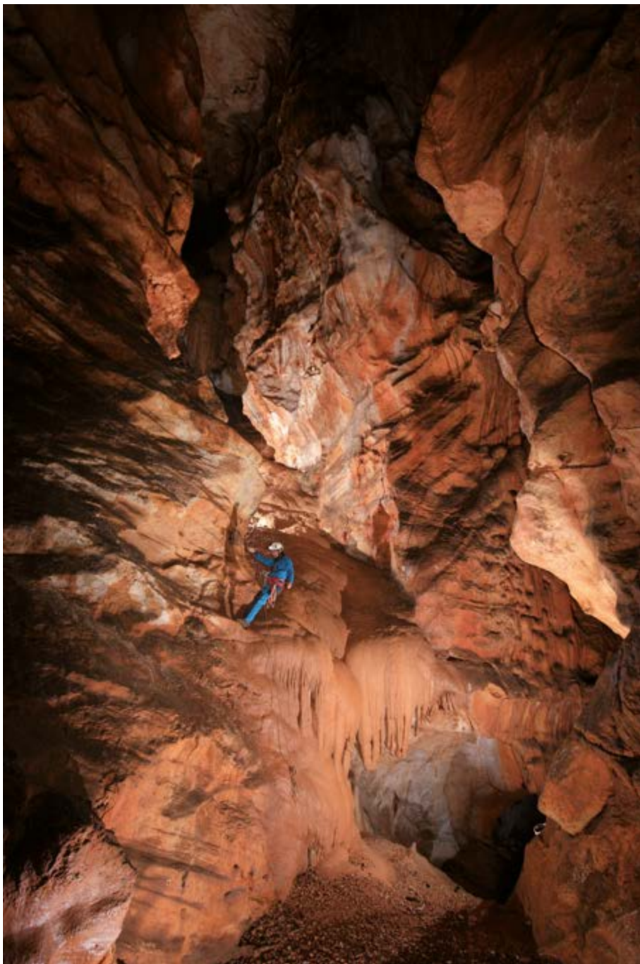
Arrivée à la galerie Martel, au bas du toboggan