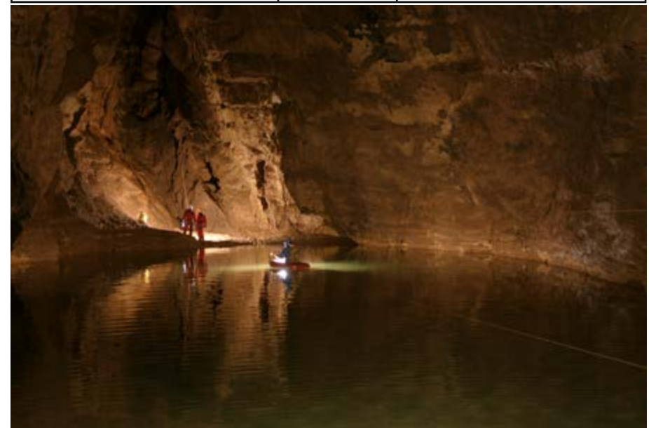
Navigation sur le lac